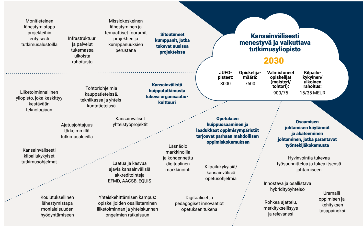
Kuvio 2. Vaasan yliopiston visio, strategiset haasteet ja strategiset kyvykkyudet

Strategisten haasteiden vasemmalle puolelle on kuvattu kyvykkyudet eli resurssien ja prosessien yhdistelmät, joita tarvitaan tavoitetilan saavuttamiseksi.