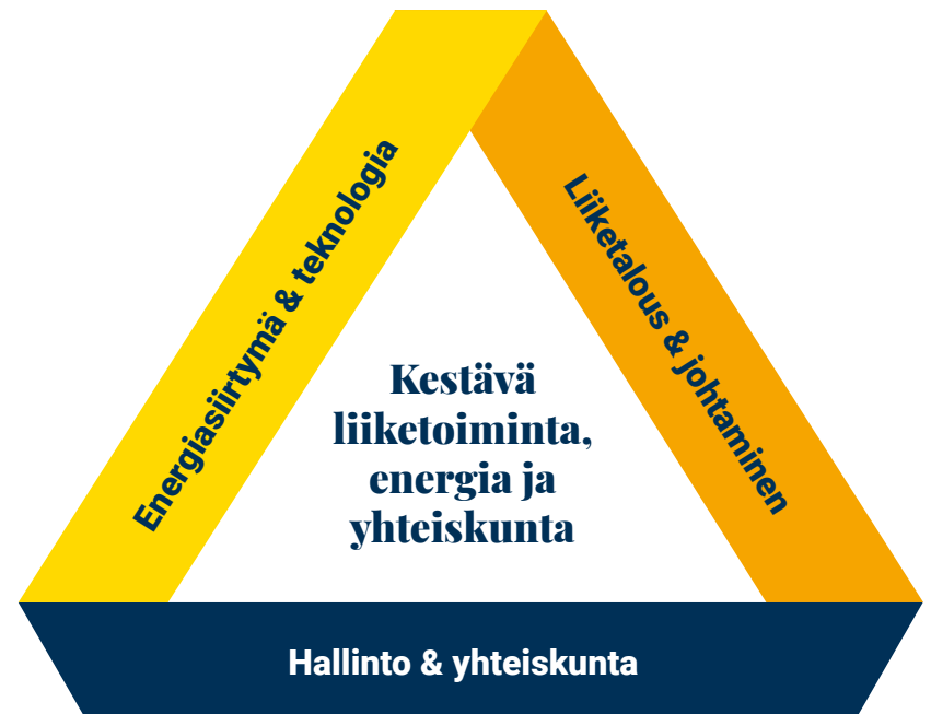
Kuvio 1. Vaasan yliopiston tehtävä ja painopistealueet

Yliopisto sijaitsee modernilla, kauniilla merenranta-kampuksella, joka tavoittelee hiilineutraaliutta. Kampus on osa kansainvälistä opiskelijakaupunkia. Vaasan seudun yhteisöllinen innovaatiotoiminta ja taloudellinen vaikuttavuus tunnustetaan kansallisesti ja kansainvälisesti, mikä luo erinomaisia mahdollisuuksia tutkijoillemme, opettajillemme ja opiskelijoillemme.