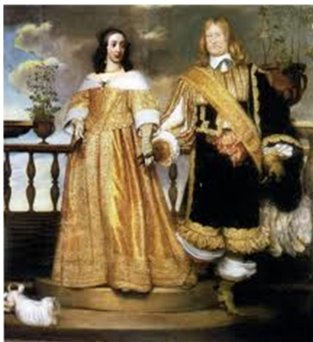
Abbildung 1. „Doppelporträt“.

Betrachten wir aber das Doppelporträt von Magnus Gabriel De la Gardie und seiner Gattin Maria Eufrosyne, gemalt von Hendrick Munnichhoven 1653, Abbildung 1 (vgl. etwa Countess Palatine 2012, Malmberg 1978: 73). Als reine Abbildung von diesem Paar, als reine Dokumentation davon, wie das Paar damals aussah, geht es um ein im obigen Sinne motiviertes Bild, das in diesem Sinne auch als Kunst „genossen“ werden kann. Ursprünglich ging es aber vor allem um ein „Dokument“, das die Stellung des Paares in der damaligen Gesellschaft dokumentiert und deshalb voll von, zwar mehr oder weniger deutlich motivierten, aber trotzdem konventionellen Symbolen ist. Der Hund und die Tatsache, dass die beiden sich an den Händen halten, symbolisieren Treue, die Bohnenhülse in der rechten Hand der Frau, dass sie schwanger ist. Weiter steht der Mann mit einem Fuß auf einer niedrigeren Treppenstufe, was zeigt, dass der Mann auch niedrigerer Herkunft als die Frau (Schwester des Königs) war (vgl. auch etwa Countess Palatine 2012).