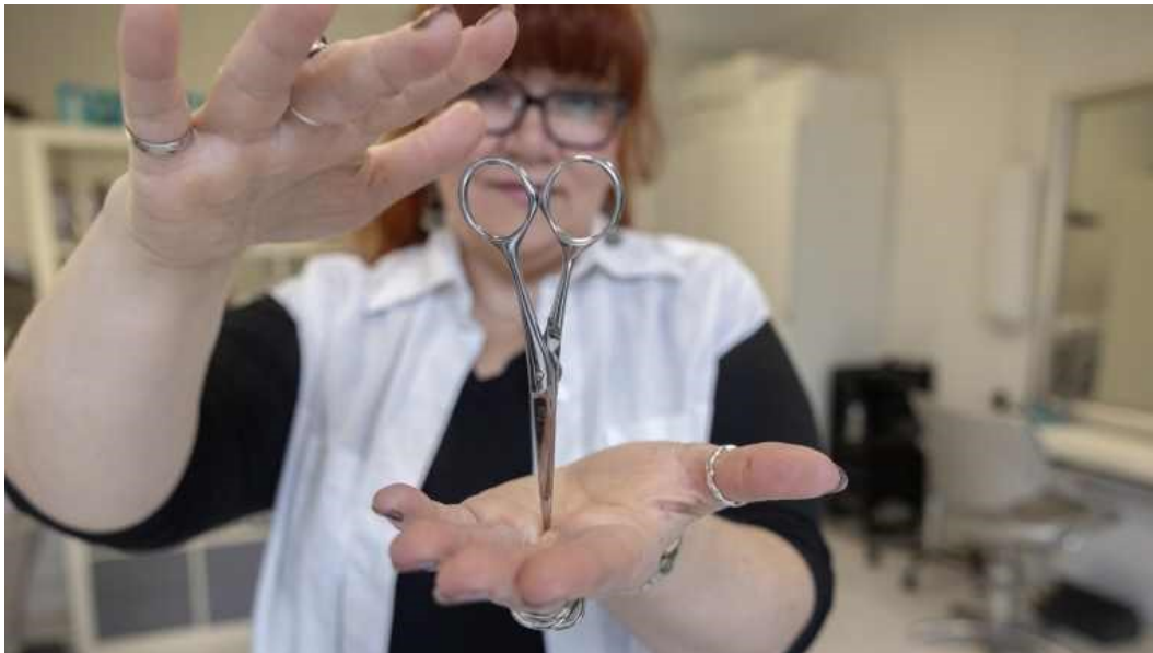
Pienyrittäjän työ on tasapainottelua.

Yrittäjyys on jatkuvaa oppimista ja mukautumista, Mikalunas ajattelee. Hän seuraa aktiivisesti alansa trendejä, esimerkiksi Instagramissa ja Tiktokissa ja osallistuu koulutuksiin.